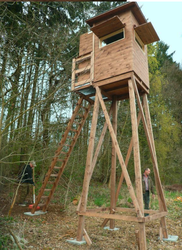
Hohen Komfort bietet die geschlossene Kanzel. Sie ist gedämmt und mit Teppichboden ausgeschlagen