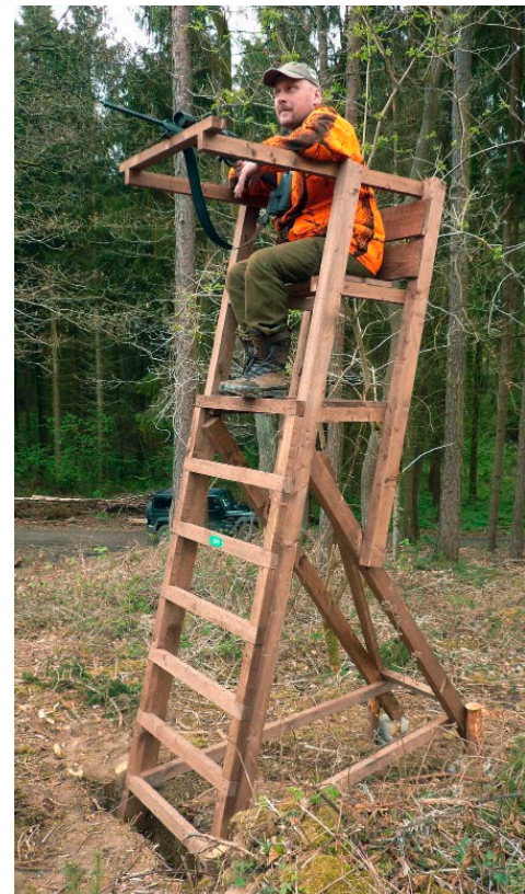
Die freistehende Leiter ist auch für Bewegungsjagden geeignet